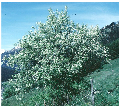
Il pado, simile al ciliegio, in fiore nel fondovalle