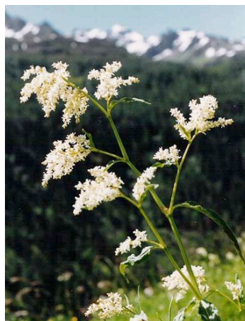
Il poligono alpino occorre solo in V. Bedretto, Goms e Mesolcina