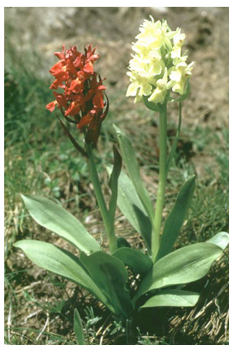
L'orchide sambucina delle Alpi centrali/meridion., una delle 24 sp. di orchidee della Valle