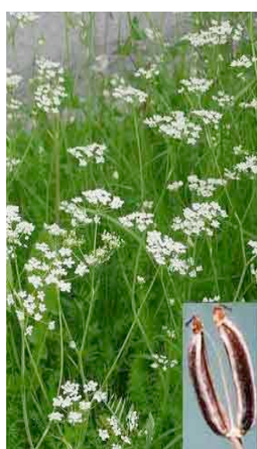
Il cumino, assai frequente nei prati, una delle poche specie indigene