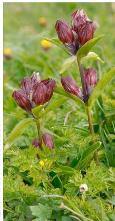
Genziana porporina, alta \leq 60 cm