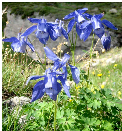
Aquilegia alpina: rara bellezza, protetta