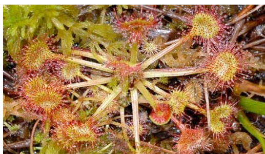
Drosera a foglie rotonde, una delle 6 specie di piante carnivore della Valle Bedretto