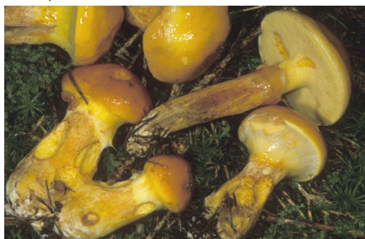
Boleto elegante, una tra le 2'000 e oltre specie di funghi (inclusi parassiti, saprofiti, micorriza, muffe, melata ecc.), licheni e microorganismi della Valle Bedretto