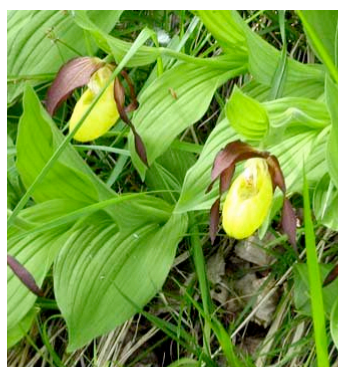
Scarpette della madonna, protetta come tutte le orchidee